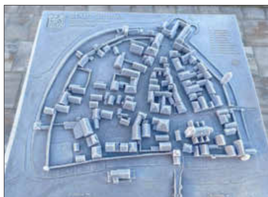
Frozen Altstadt Ornau