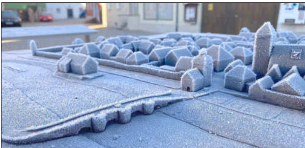
Frozen Altstadt Ornau