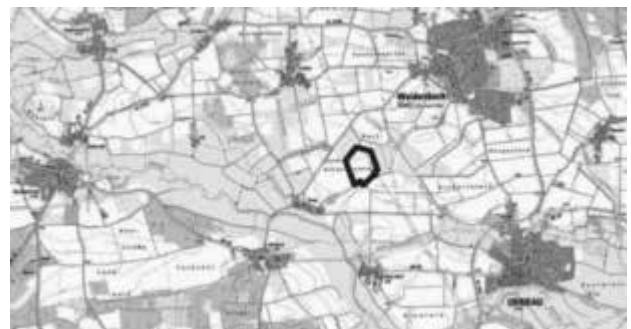
topographische Karte mit Darstellung des Änderungsbereichs in blau, Maßstab 1:50.000 (DTK25 © Bayerische Vermessungsverwaltung, < www.geodaten.bayern.de >